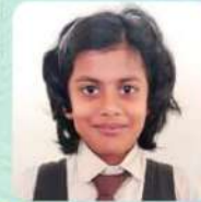
THARA.K C-2574, V-B