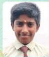
OWSHITHAN.S.K C-2508, V-B