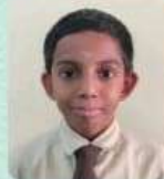
AMRIT.A C-2513, VII-B